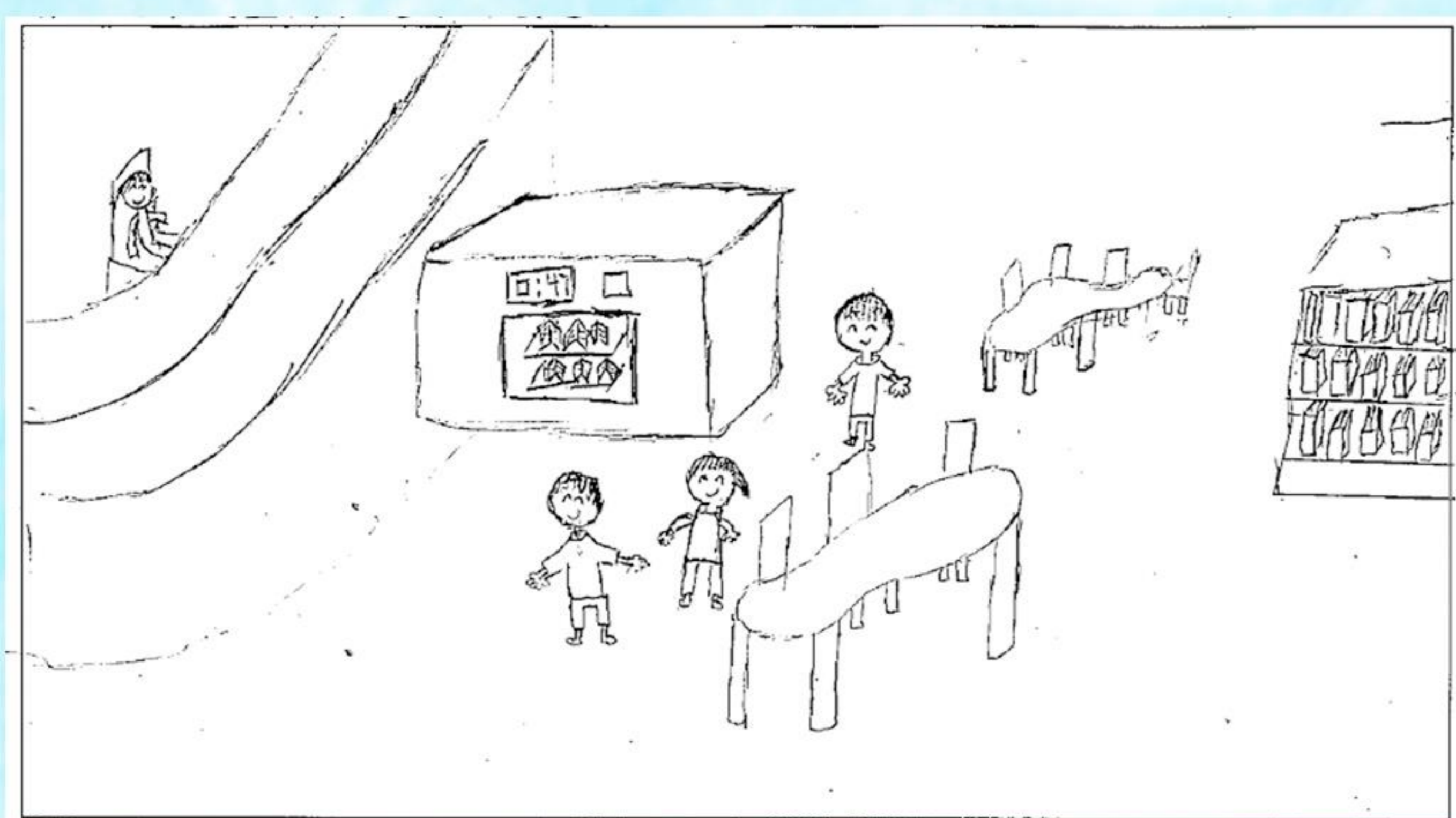
3A 蘇駿文 《充滿歡樂的圖書館》