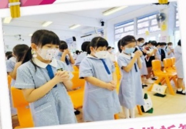
同學們都在誠心地祈禱